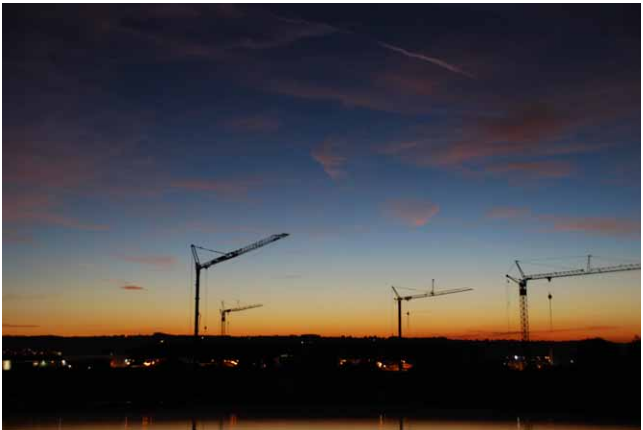
Eindrücke vom Neubaugebiet Dorfanger bei Nacht