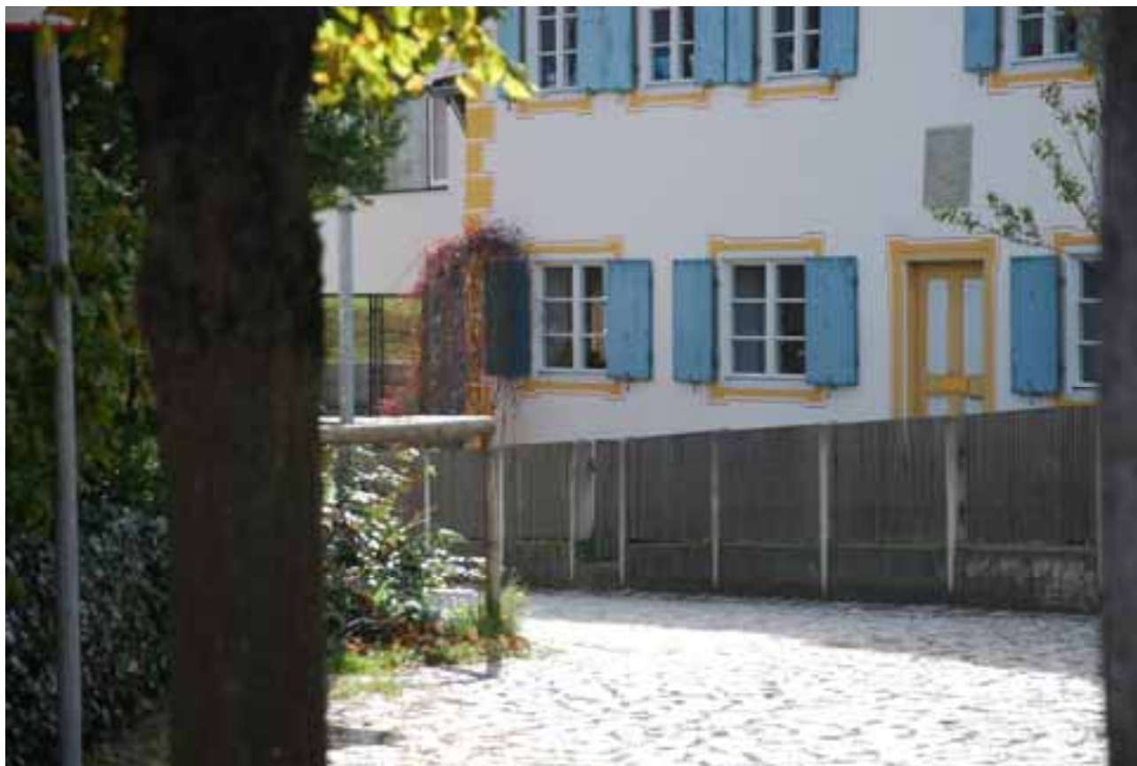
Blick zur Hörmannschule