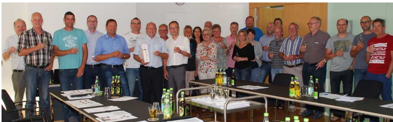
Kleine Feierstunde bei der öffentlichen Gemeinderatssitzung am 11. Juni – Armin Holderried im Kreise des Gemeinderats und der zahlreichen Zuhörer

Am 01.06.2015 jährte sich der Dienstantritt unseres Ersten Bürgermeisters Armin Holderried bei der Gemeinde Mauerstetten zum 25. Mal.