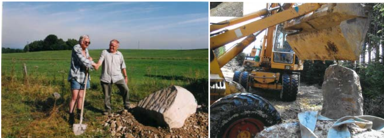
Spatenstich am Keltenturm

Am Anfang des Weges findet man einen Ruheplatz mit Steintisch und altem Bauwagen, bevor man in den Wald eintaucht und den Weg auf sich wirken lässt. Als Rundweg angelegt, kommt man den lustigen Wegweisern mit der Symbolfigur „Tannenkelte“ folgend über den Abschnitt mit Sinnsprüchen zum Nachdenken und dem großen Aussichtsturm wieder zum Ausgangspunkt zurück. Man kann aber auch den Weg am Stockerberg beenden und übers Dorf weiter wandern.