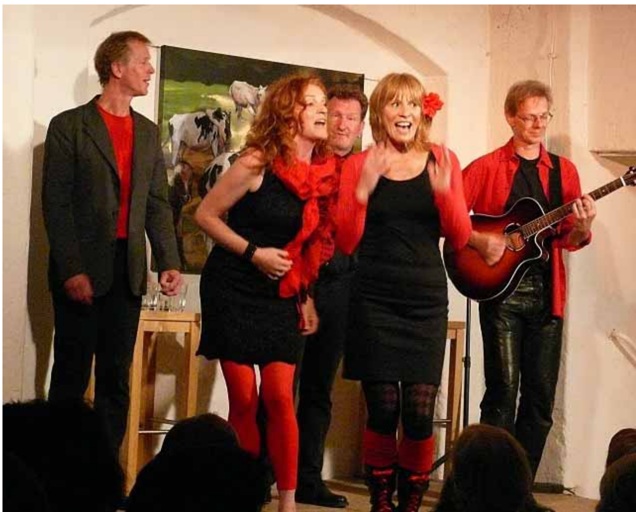
Das Vokalensemble 5 Gramm

Eintrittspreise: 14,00 EUR Erwachsene, 10,00 EUR ermäßigt (Schüler, Studenten).