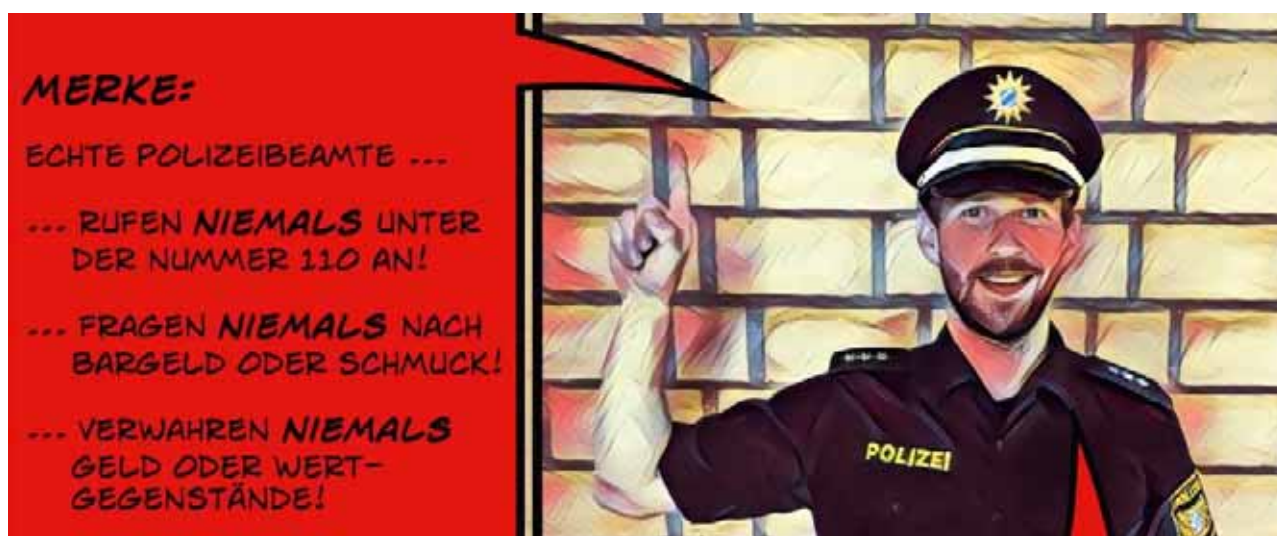
Polizeipräsidium Schwaben Süd/West, Seniorenberater