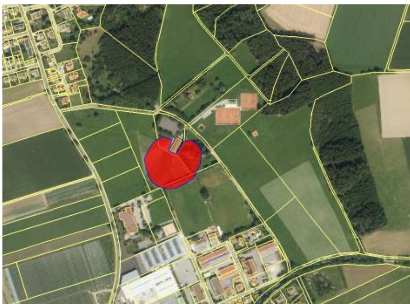
Luftbild unmaßstäblich

Dieses Bodendenkmal, als auch der erweiterte Schutzbereich, sind von der 1. Änderung und Erweiterung des Bebauungsplanes Nr. 22 „Sportanlagen Nord“ nicht betroffen.