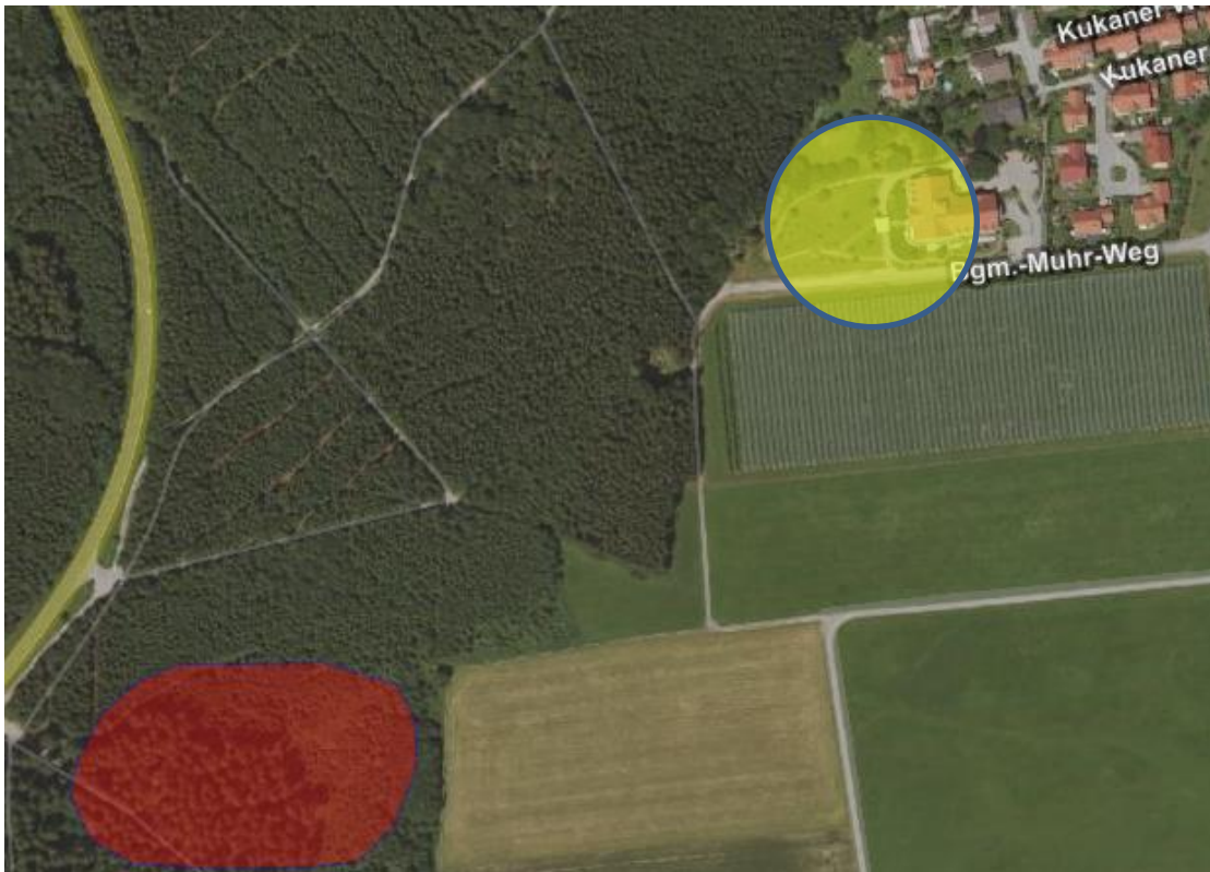
Luftbild unmaßstäblich