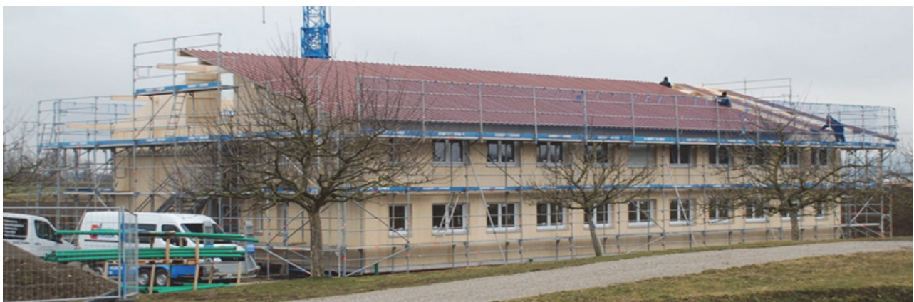
Asylbewerberheim am Unterangerweg

Das Asylbewerberheim am Unterangerweg ist im Rohbau fertig, nun werden die notwendigen Innenarbeiten ausgeführt, die geplante Inbetriebnahme ist für April dieses Jahres vorgesehen. Nachdem im Landkreis voraussichtlich bis Mitte dieses Jahres jetzt schon planbar ausreichend Unterkünfte bereitstehen, hoffen wir, dass die 54 Plätze dort nicht auf einmal belegt werden, sondern innerhalb einer angemessenen Frist, was uns den Empfang der Menschen sicherlich sehr erleichtern würde.