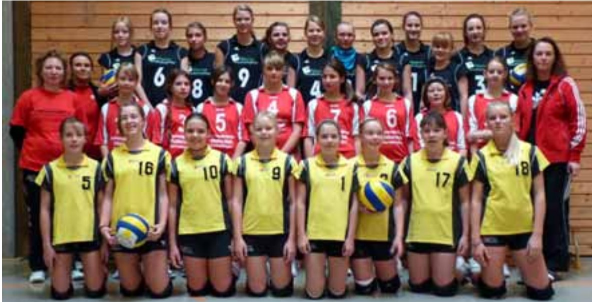
Die drei C-Jugend-Teams

In Germaringen gingen gleich 3 C-Jugend-Teams an den Start. Gegner waren nur 2 Teams aus Sonthofen, welche von allen Mauerstettener Mannschaften geschlagen wurden.