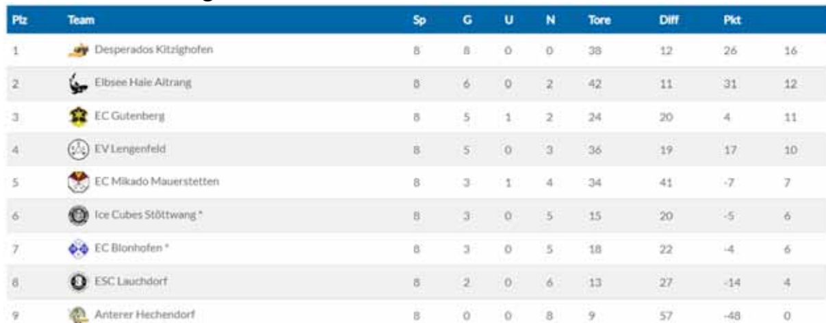
Tabelle Yes-Licht Liga:

Der Ligabetrieb neigt sich dem Ende zu. Leider verlief der Januar nicht ganz nach unseren Vorstellungen. In den drei letzten offiziellen Spielen der Yes-Licht Liga, mussten wir uns jeweils unseren Gegnern aus Blonhofen, Aitrang und Lengenfeld geschlagen geben. Dank der besseren Vorrunde in den Monaten davor, konnten wir allerdings mit dem 5. Tabellenplatz eine gute Platzierung sichern und erkämpften uns somit das Pre-Playoff Spiel als Revanche gegen Lengenfeld. Durch einen Sieg würden wir dann in das Halbfinale der Playoffs einziehen, wo schon Gegner wie Kitzighofen oder Aitrang warten.