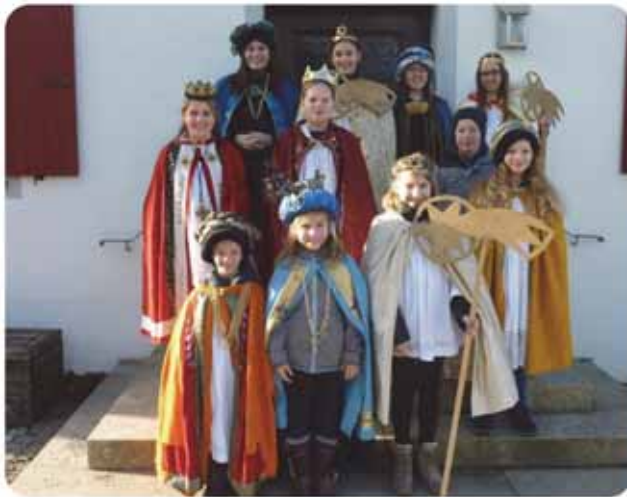
Sternsingergruppe 1 aus Mauerstetten