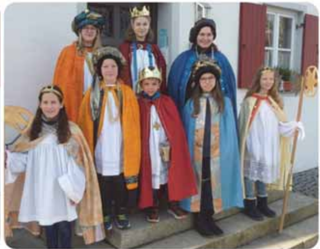
Sternsingergruppe 2 aus Mauerstetten