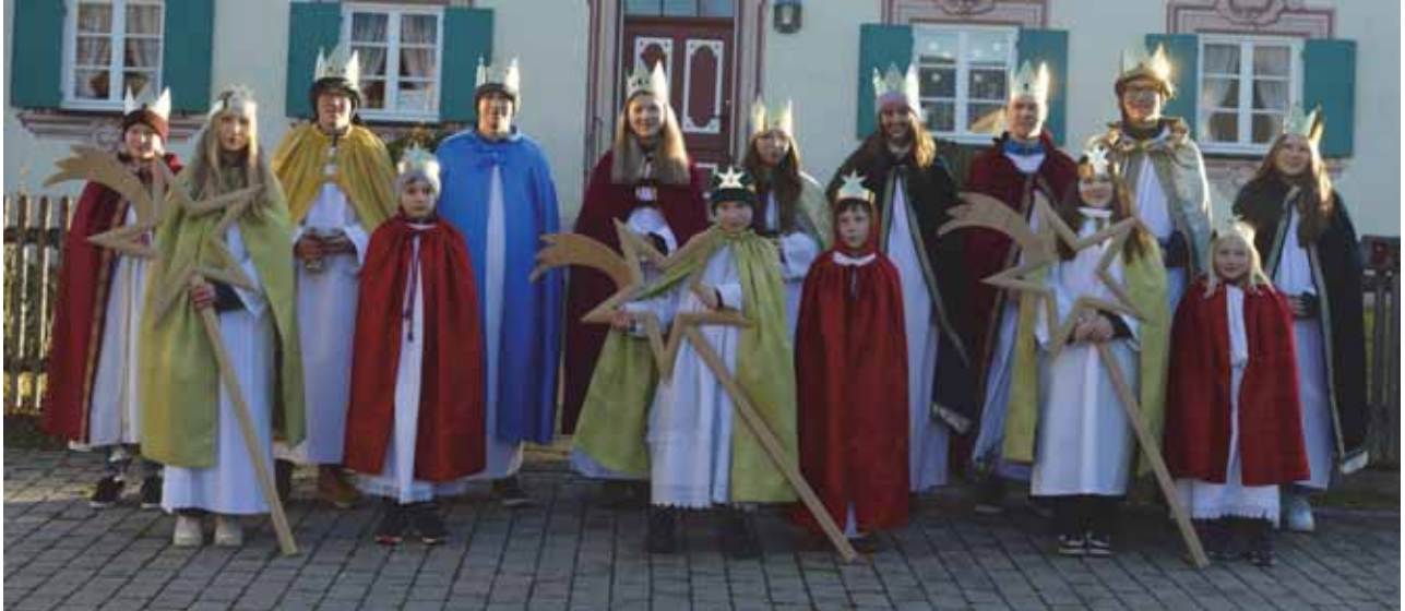
Sternsinger aus Frankenried