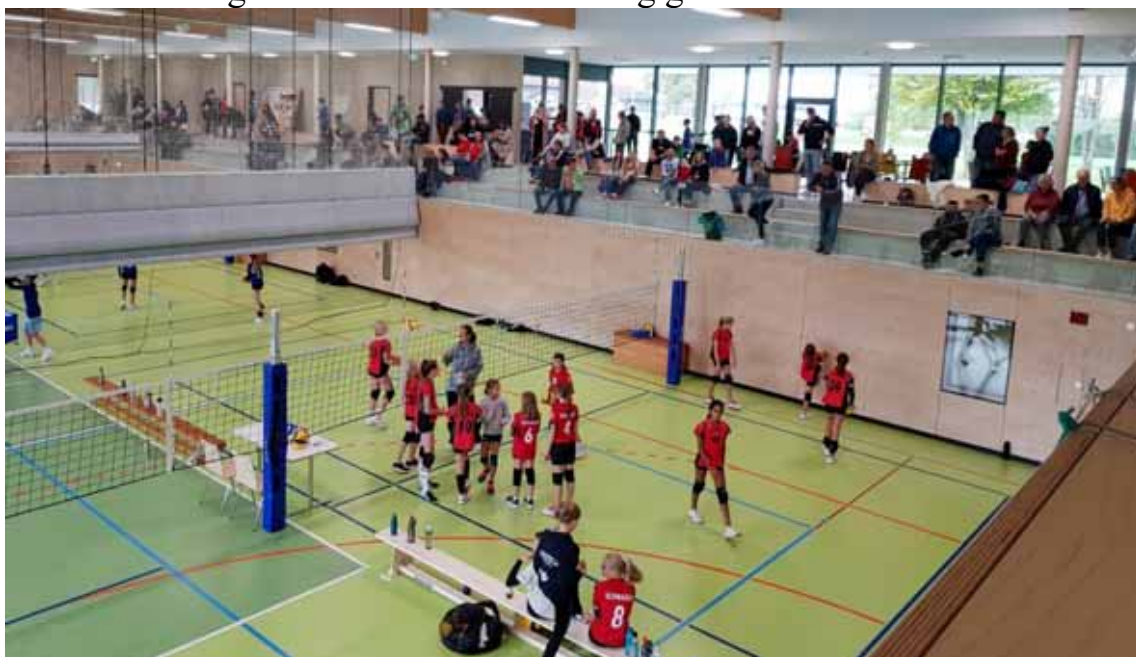
Das Bild zeigt die Stimmung mit vollen Spielfeldern und vollen Zuschauerrängen.

Zum Schluss gab es noch sehr viele lobende Worte an den Ausrichter, der sich perfekt um die Vorbereitung der Halle und das Catering gekümmert hat.