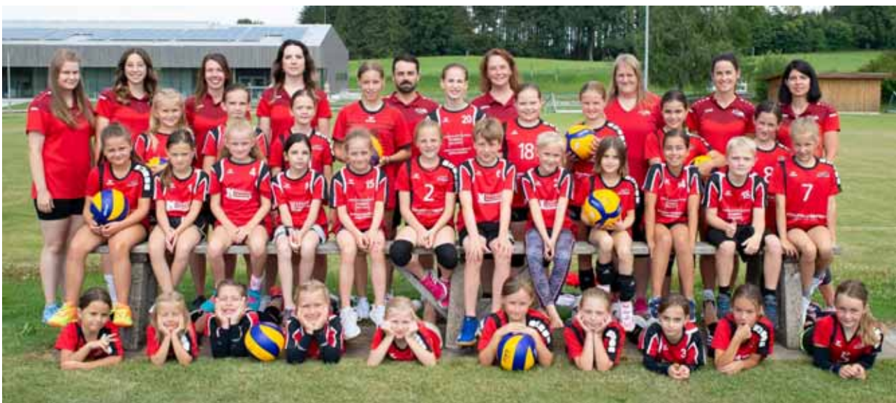
Das Bild zeigt die vielen Kinder, die sich auf ihre Punktesaison freuen.

Wir freuen uns über viele Zuschauer und über schöne Spiele.