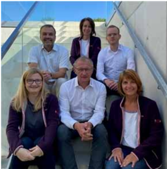
Der neue Vorstand beim SV Mauerstetten e.V.

Die Versammlung wählte jeweils einstimmig die vorgeschlagenen Kandidaten.