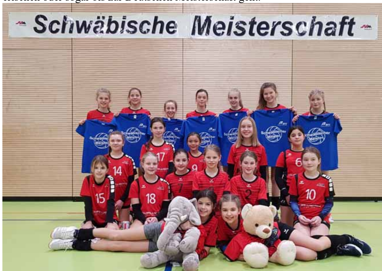
Das Bild zeigt die drei erfolgreichen U14 Teams bei der Schwäbischen Meisterschaft in eigener Halle.

Man darf gespannt sein, für welche Altersklassen es über die Südbayerische zur Bayerischen oder sogar bis zur Deutschen Meisterschaft geht.