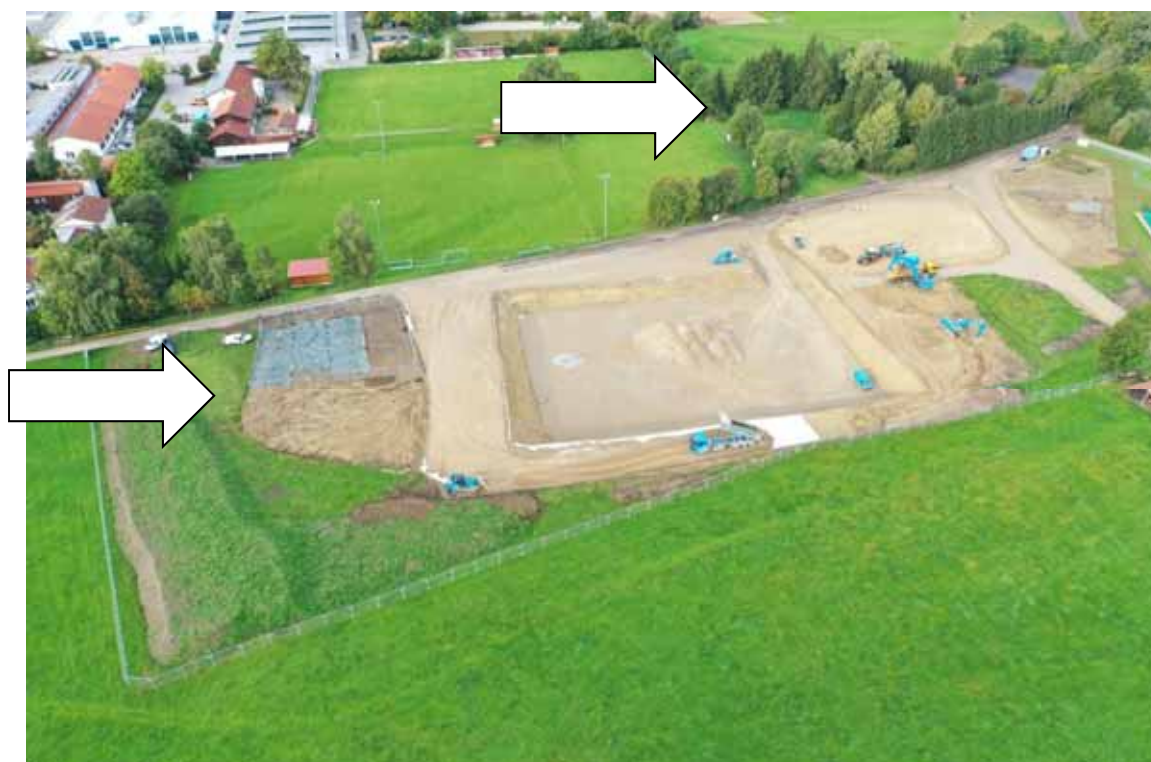
„Grabhügel der Hallstattzeit“, der beim Bau der neuen Fußballfelder eingeebnet wurde in der Waldvegetation oben rechts - In der Bildmitte links das teilweise abgeplante Grabungsareal

Etwa 250 Meter von dem abgegrenzten Areal entfernt befindet sich das Bodendenkmal D-7-8030-0036 „Grabhügel der Hallstattzeit“, in dessen Bereich Sigulf Guggenmos 1985 etwa 50 Keramikscherben der Hallstattzeit aufgelesen hatte.