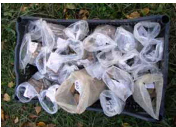
Fundstücke in Tüten einsortiert