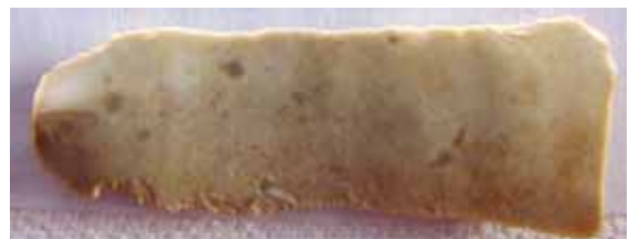
Artefakt aus Jurahornstein - Ventralseite