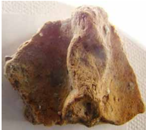
Prähistorische Keramik mit Fingertupfenleiste