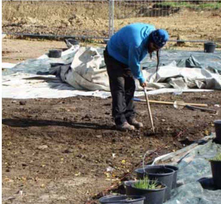
Links unten: Weißes Fähnchen, mit dem eine Fundstelle markiert wird. – Bildmitte unten: Zwei weitere Fähnchen als Fundortmarkierungen

Zu den Funden lässt sich sagen, dass die ältesten Befundzusammenhänge steinzeitlich datieren. Ein wichtiger Befund für die Urgeschichte unserer Gemeinde.