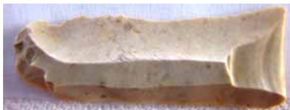
Artefakt aus Jurahornstein - Dorsalseite