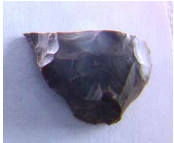
Silexartefakt aus Radiolarit