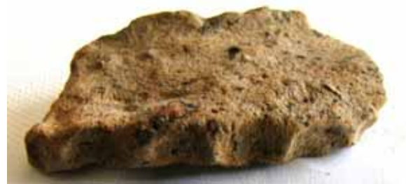
Randscherbe mit Tupfen