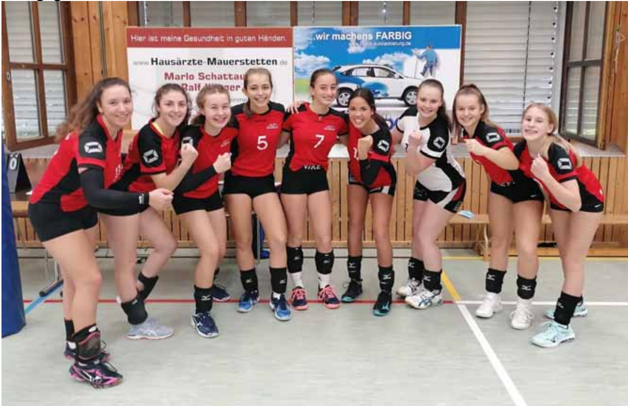
Das Bild zeigt die erfolgreiche Damen 3 Mannschaft nach ihrem Sieg gegen den TSV Pfuhl.

In Sonthofen begann die U14 Runde mit zwei SVM-Teams. Teams 1 konnte ihre Spiele gegen Türkheim, Bad Grönenbach und Sonthofen gewinnen und Team 5 setzte sich gegen Bad Grönenbach durch.