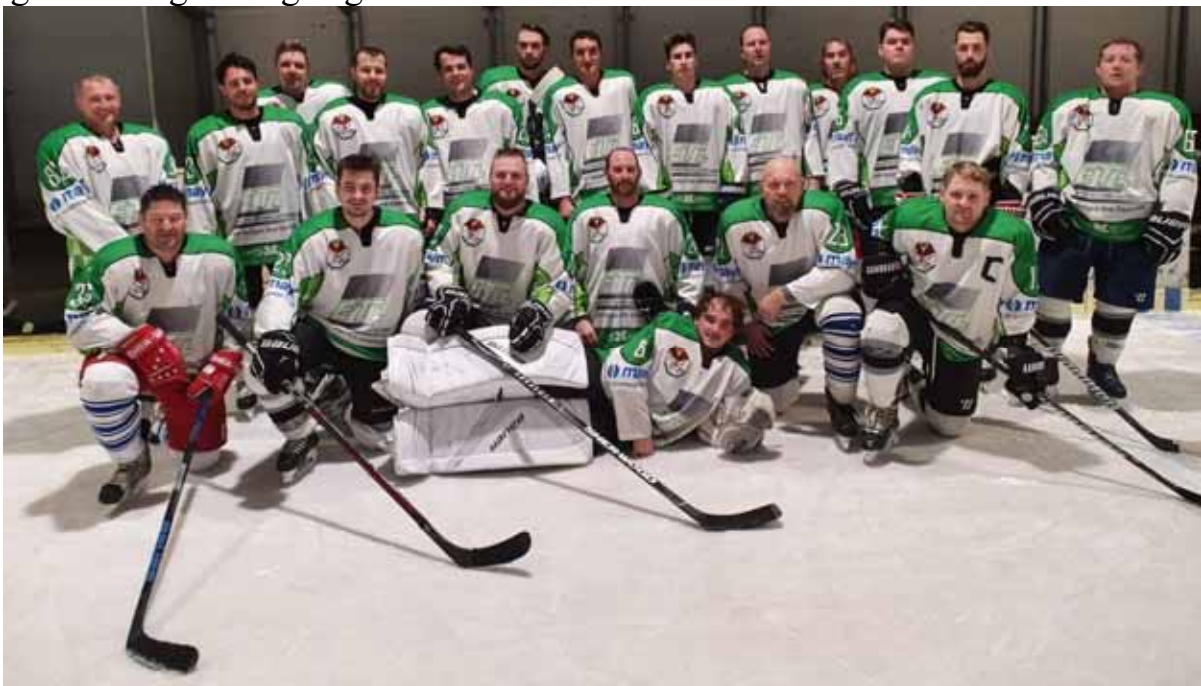
EC Mikado 1b – nach dem Spiel gegen den SV Mindelzell

Auch die 1b Mannschaft des EC Mikado bestritt im Rahmen des „Hobby Hockey Cup“ zwei Spiele. Zunächst stand ein Spiel gegen die Waldler Buam an, welches die 1b der Mikados nach einem 3:0 Rückstand noch mit 3:7 für sich entscheiden konnte. Als nächstes ging es gegen den SV Mindelzell. Hier musste sich die EC Mikado 1b allerdings mit 8:1 geschlagen geben.