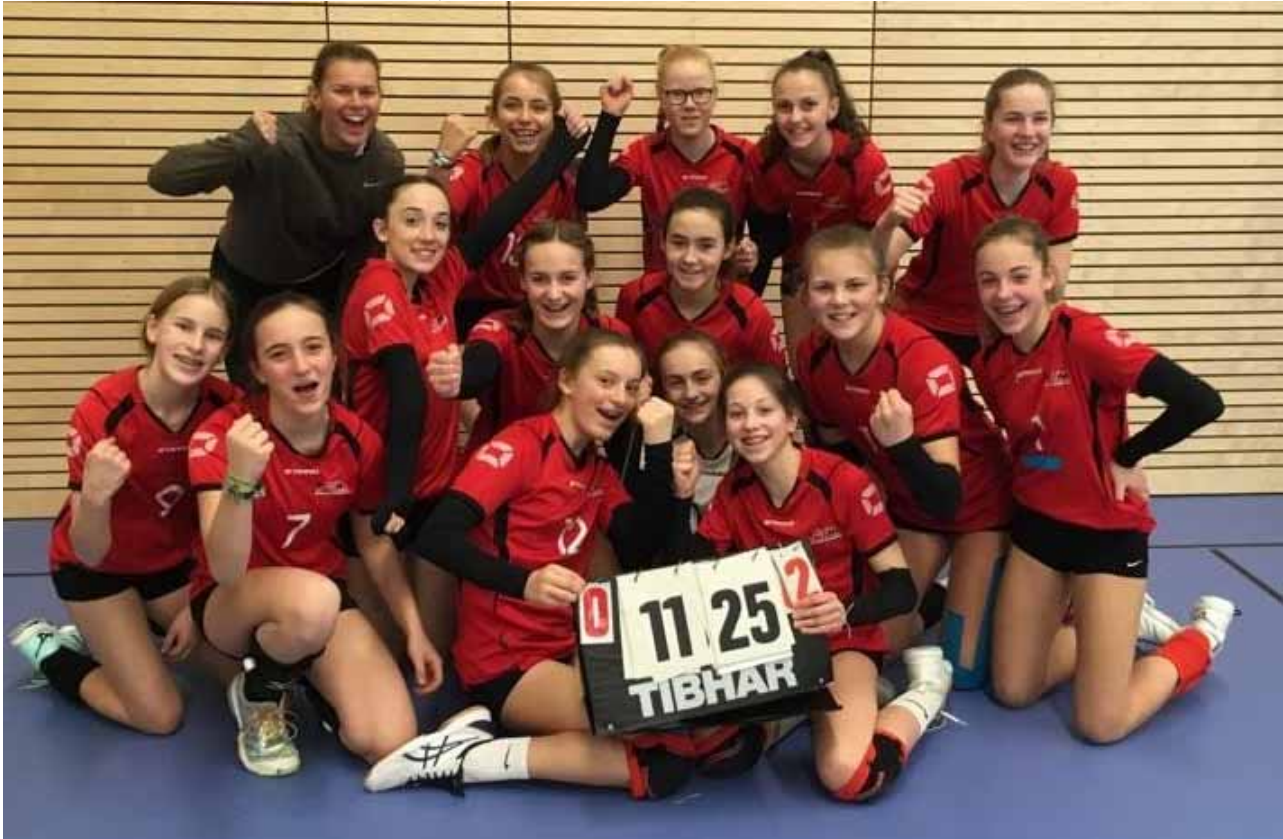
Das Bild zeigt die erfolgreichen U16 Mädels nach ihrem dritten Platz bei der Südbayerischen Meisterschaft.

Gleichzeitig spielte die U16 ihre Südbayerische Meisterschaft in München. In der Gruppenphase nur dritter, mussten sie ins Überkreuzspiel, welches sie gegen Vilsbiburg gewannen. Ein weiterer Sieg gegen den Gruppenersten Sonthofen brachte die Mädels in Halbfinalspiel gegen Rosenheim, welches an die Oberbayern ging. Im Spiel um Platz drei ging es dann für die junge Mannschaft gegen Lenggries. Jetzt zeigten sie nochmals was sie können und so holten sie sich den dritten Platz mit 28:26 und 25:11. Somit fahren auch sie zur Bayerischen Meisterschaft am 07./08.03.2020