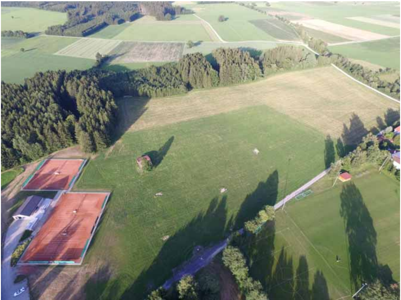
Unser neuer Sportcampus vor den ersten Arbeiten....