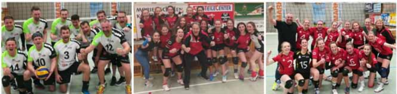
Links: Herren des SV Mauerstetten nach ihrem erfolgreichen Relegationsspieltag.

Ein wahnsinnig tolles Volleyball-Wochenende ging vorbei. Doch die Mädels machten den Abend nun zum Tag und feierten ihren Aufstieg noch sehr gelassen im Sonnenhof. An dieser Stelle nochmal allen drei Mannschaften herzlichen Glückwunsch!!!