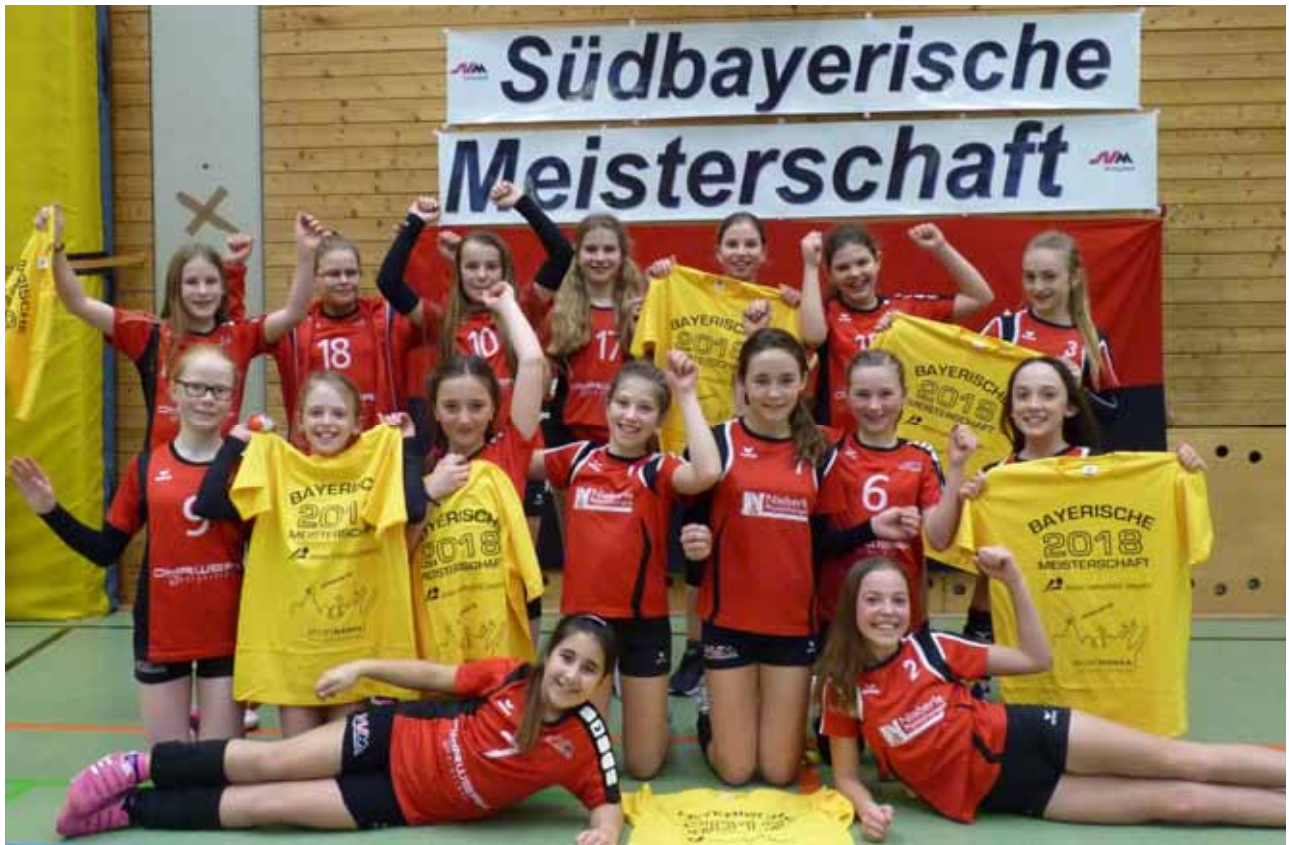
Das Bild zeigt die erfolgreichen U13 Mädchen.