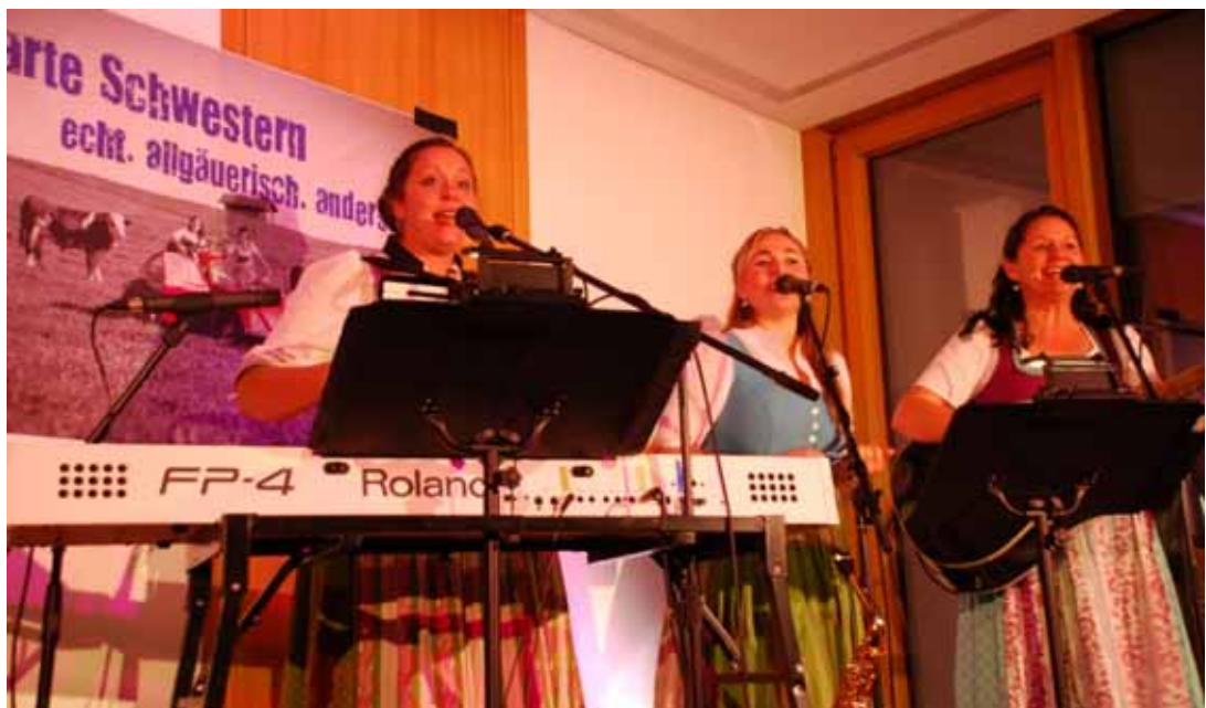
Die Harten Schwestern in Aktion!