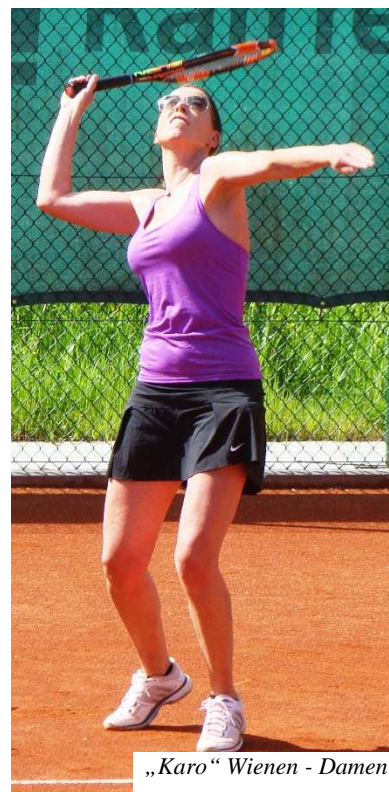
„Karo“ Wien - Damen