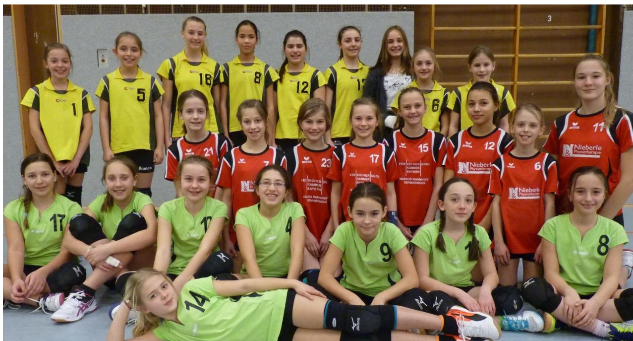
Das Bild zeigt die U14 Mädels nach dem Gewinn der Schwäbischen Meisterschaft