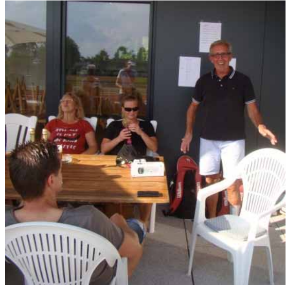
Ein glücklicher Präsident: R. Bartels

Aus den weiteren Platzierungsspielen resultierte dann die nachstehende Rangfolge: