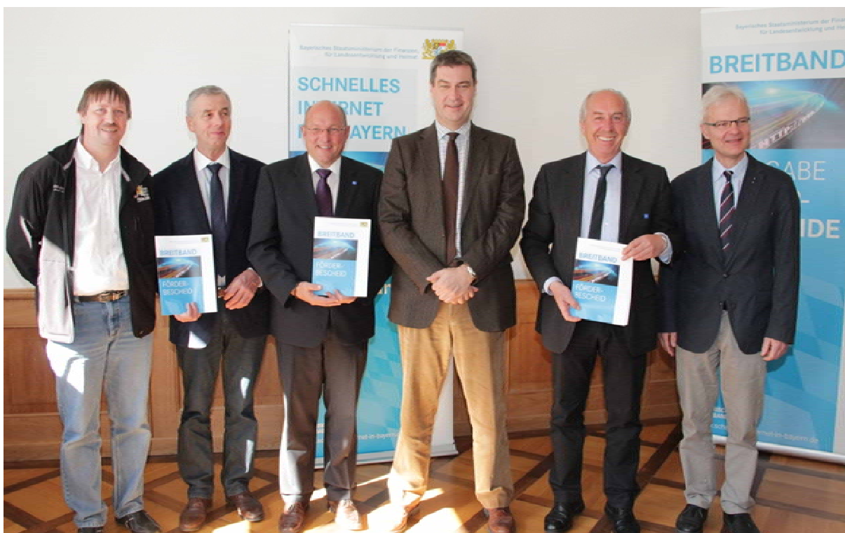
Die betroffenen Bürgermeister aus dem Ostallgäu mit Finanzminister Söder bei der Übergabe der Förderbescheide.