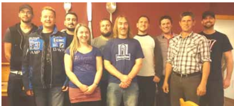
Alte und neue Vorstandschaft