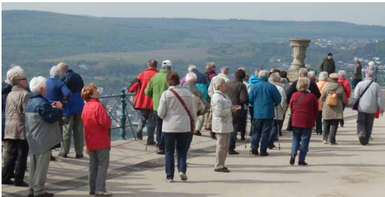
Ein Teil der Reisegruppe mit Führerin vor dem Niederwalddenkmal mit Ausblick ins Rheintal.

Obwohl die Wetterprognosen nicht rosig waren, wagte die Reisegesellschaft den Besuch im Oberen Mittelrheintal. Bei Regenwetter eingetroffen, besserte es sich am nächsten Tag. So konnte bei Sonne mit der Seilbahn zur Besichtigung der Germania -Niederwalddenkmal- gestartet werden.