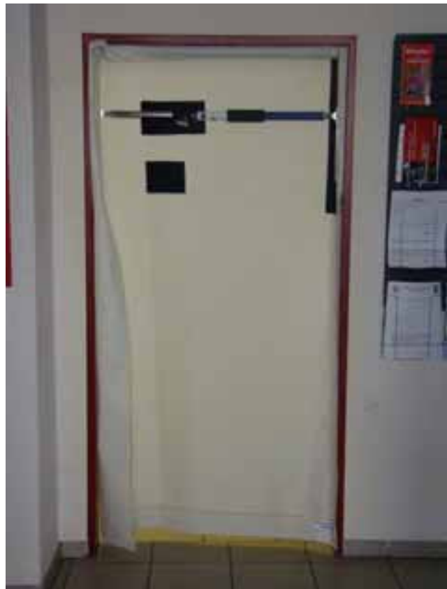
Funktionsweise des Rauchverschlusses