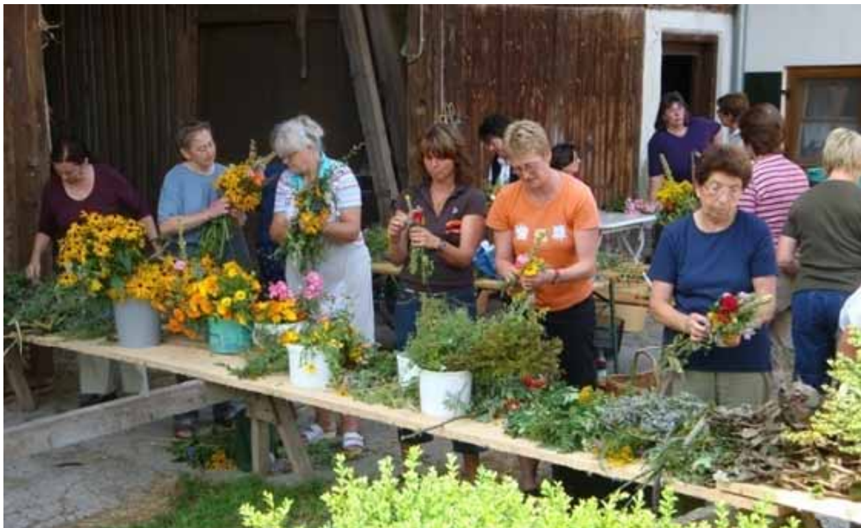
Kräuterboschen binden 2009

25-Jahre Frauenbund Mauerstetten Zum Festgottesdienst mit Fahnenweihe am Sonntag, den 11. Oktober 2009 um 10.00 Uhr laden wir die ganze Gemeinde recht herzlich ein zum Mitfeiern.